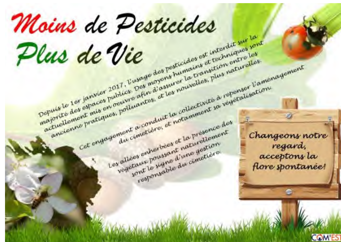
Exemple de plaquette