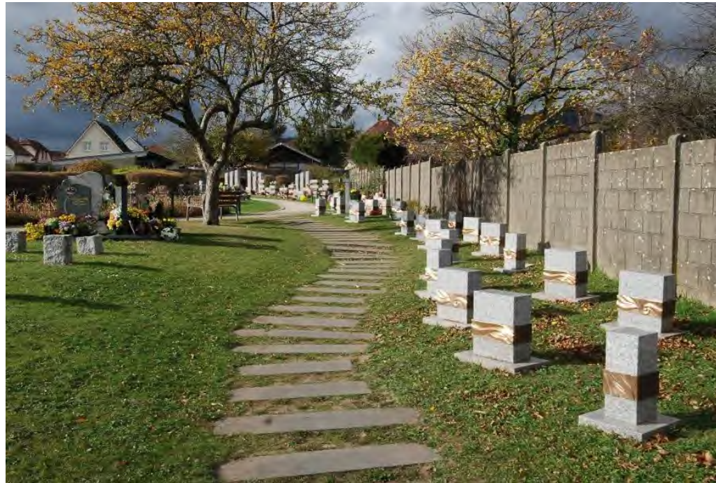
Un exemple de cimetière végétalisé : Cernay (68)

Etudier les différents éléments du cimetière