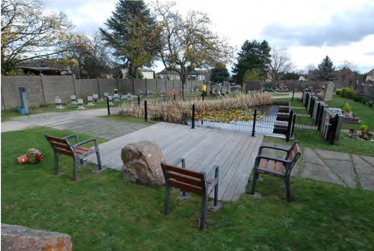
Un exemple d'aire de dispersion : Cernay (68) Photo 2015