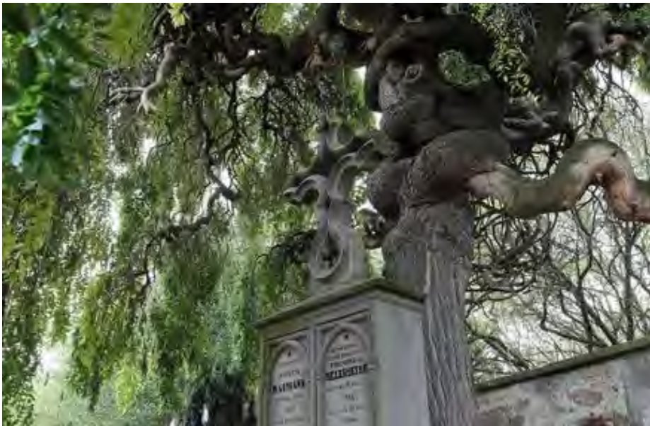
Sophora du japon au cimetière de Bollwiller (68)

Les arbres et les arbustes : obligation d'entretien par la commune + limitation de la hauteur sur les sépultures par règlement communal.