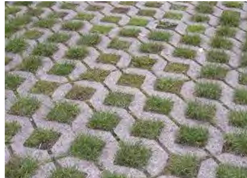
Dalles de béton alvéolées

http://www.rtl.fr/actu/conso/comment-mettre-en-place-des-pas-japonais