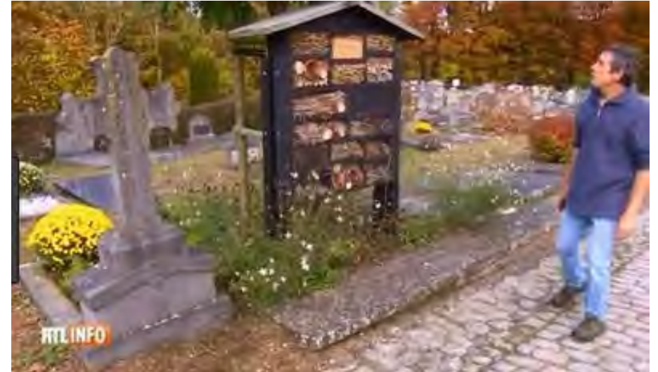
Ruches au cimetière d'Ohain