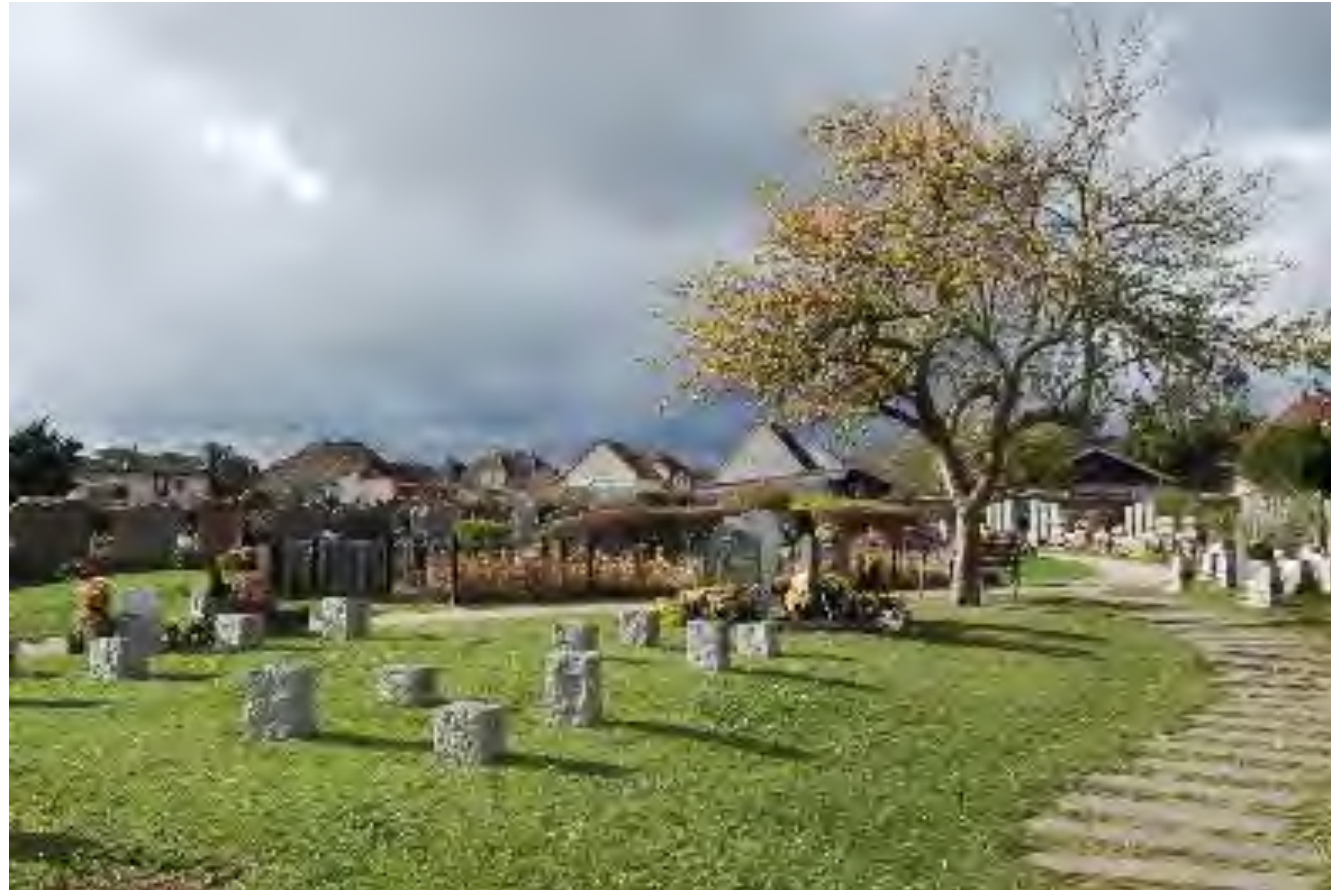
Un exemple d'espace dédié aux cavurnes : Cernay (68) Photo - 2015